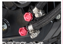
オイル取り出しイメージ